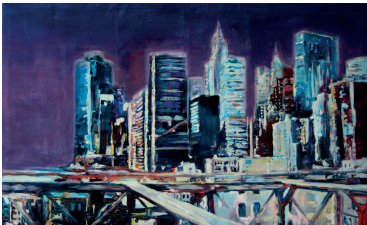
Tóth Angelika: Metropolis NY III.