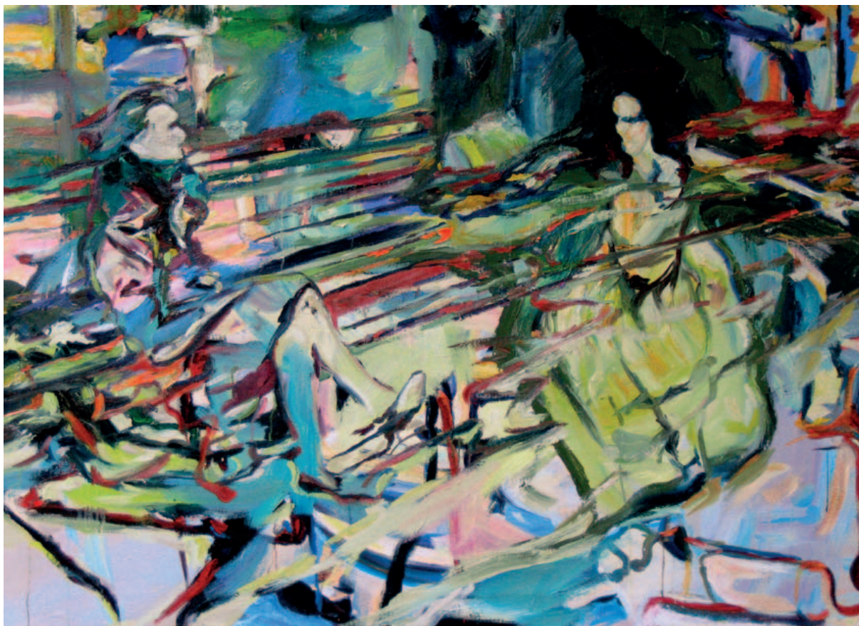
Tóth Angelika: Serpentine II.