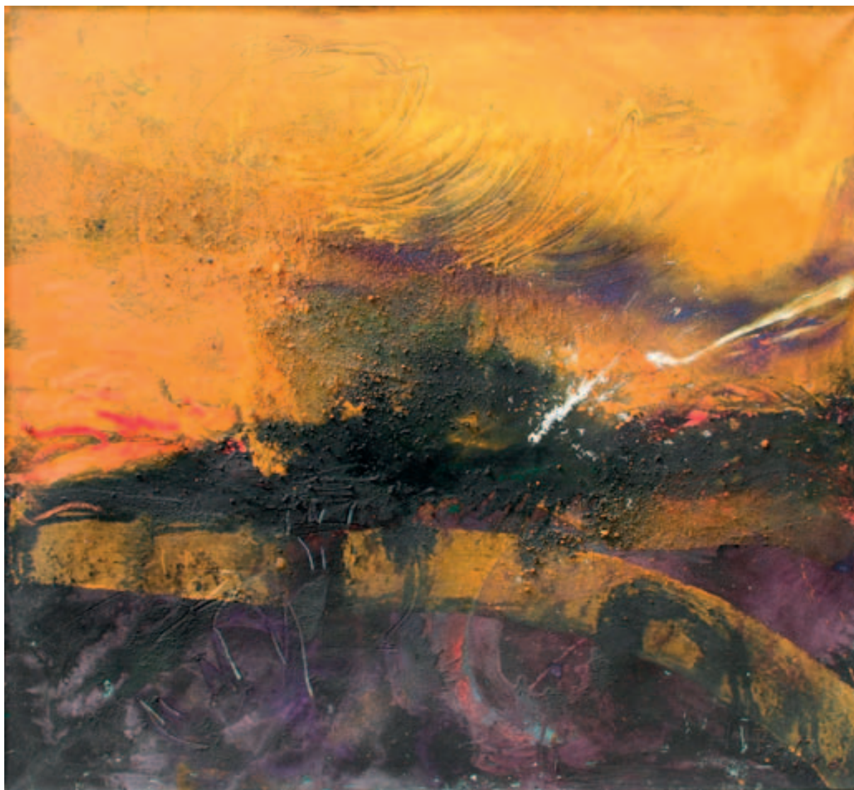
Balla Attila: Nagy sárga táj

A Bank megválasztott könyvvizsgálója a PricewaterhouseCoopers Kft. nevében Balázs Árpád bejegyzett könyvvizsgáló járt el. A 2010. december 31-re vonatkozó hivatalos éves beszámolót, amely a Commerzbank Zrt. székhelyén hozzáférhető, a PricewaterhouseCoopers Kft. 2011. május 3-án korlátozástól mentes hitelesítő záradékkal látta el.